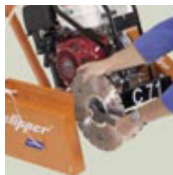
Montage aisé du disque. Frein de stationnement.