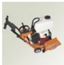
Jauge de profondeur. Crochet de levage.