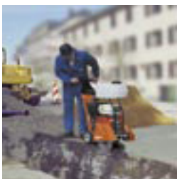
Machine ergonomique. Poignées réglables.